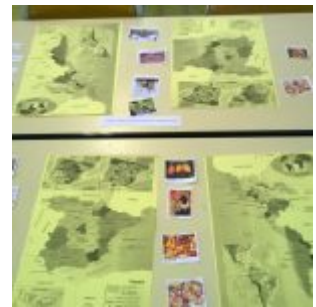
Espagnol – Découverte