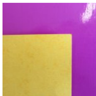
□ Bob l'éponge

Bob l'éponge est dans sa maison. Il s'ennuie. Il sort voir ses amis pour s'amuser. Il est étonné de l'eau violette. Il s'étouffe. Il décède. Les pompiers arrivent pour le mettre dans un cercueil et l'enterrer. L'eau était polluée.