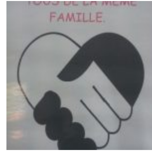
3ème prix (2) – lutte contre les discriminations