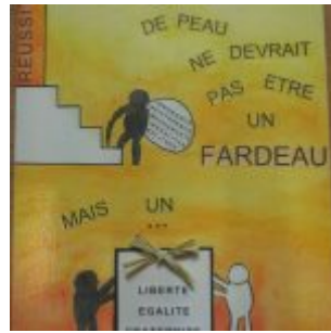
2ème prix – lutte contre les discriminations