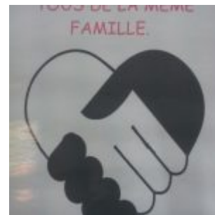
3ème prix (2) – lutte contre les discriminations