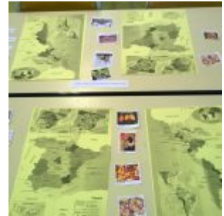
Espagnol – Découverte