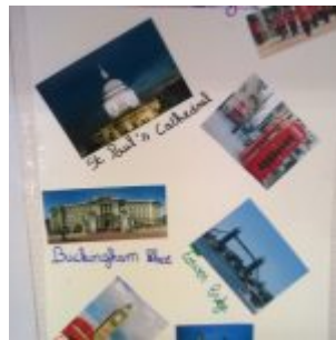
Anglais – London City