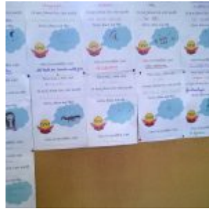
CDI – Lecture