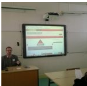
Pronote – Présentation