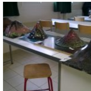
Sciences – Volcans