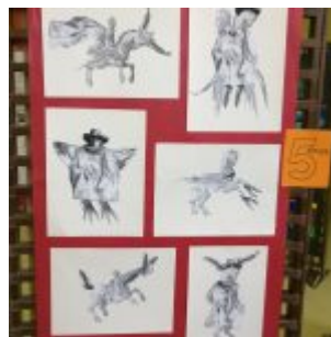
Arts plastiques 3