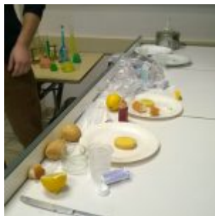
Sciences – Expériences