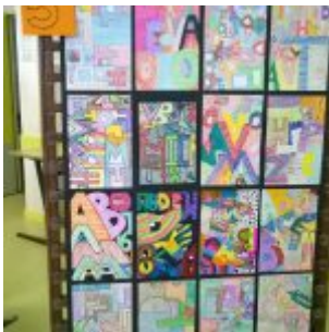
Arts plastiques 2