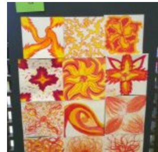
Arts plastiques 1