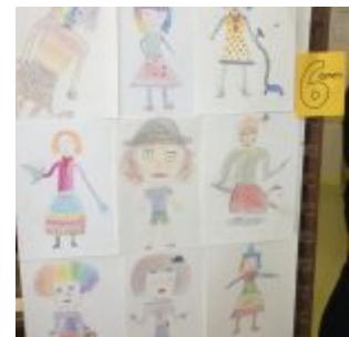
Arts plastiques 4