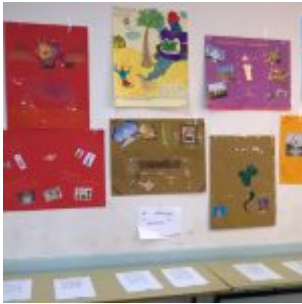
Français – Contes